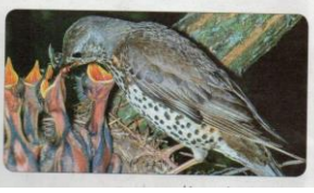
صائر السمان وصغاره