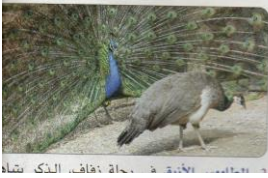
طاوس في حفلة زفاف